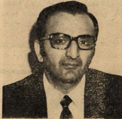
Hukuk Fakültesi mezunu, Avukat. Halen Zonguldak Barosu Başkanı. CHP İl Başkanı iken başkanlıktan ayrılarak aday oldu. Evli iki çocuklu.