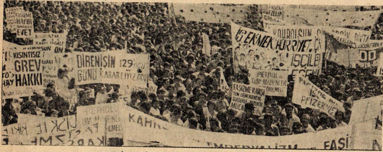
DİSK'in İstanbul mitinginden bir görünüş.

Türkiye Devrimci İşçi Sendikaları Konfederasyonu (DİSK) İzmir ve İstanbul'da düzenlediği iki açık hava toplantısı sırasında demokratik isteklerini duyurdu. Bu arada işbaşındaki DİSK yöneticileri de demokrasi anlayışlarını dile getirmiş oldu. İstekler başlıca şu noktalarda toplanmıştı: «İlerici bir hükümet işbaşına gelsin... NATO ve CEN-TO'dan çıkılsın. İkili anlaşmalar yırtılsın... Devlet güvenlik mahkemeleri kapatılsın. Yasalardaki bütün baskı maddeleri kaldırılınsın... Sendika seçiminde 'gizli oy açık sayım' yoluyla işçilerin oylarına başvurulsun.. İşçi-memur ayırımı kaldırılınsın. Bütün memurlar sendikalı olsun... Üretler artsın. İş güvenliği sağlansın...»