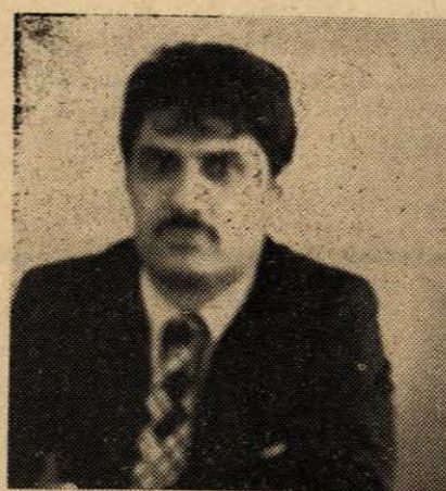
İstanbul Teknik Üniversitesi Makina Fakültesi Mezunudur. Gemlik Azot sanayiinde çalışmakta iken Zonguldak Milletvekili adayı oldu. Evli 2 çocuklu.