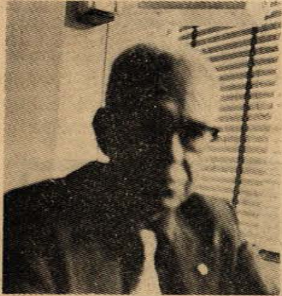
Viyana Hukuk Fakültesi mezunu. 1954-1960 yılları arasında DP Zonguldak milletvekilliği ve aynı dönem içinde Sanayi Bakanlığı yaptı.