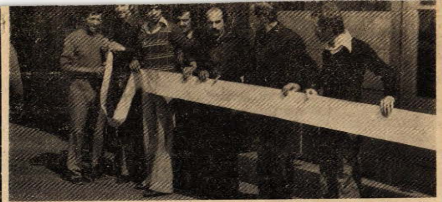
Protestoyu başlatan Merkez Atelyeleri işçileri, 830 imzalı dilekçe ile sendika binası önünde görülüyorlar.

Sosyal Sigortalar Kurumu Zonguldak Şubesi ve Devlet Hastahanesinde çalışan işçiler 2. Dönem Toplu İş Sözleşmesi yapacaklardır. Sözleşme görüşmelerini Sağlık-İş Sendikası Zonguldak Şubesi yürütecektir.